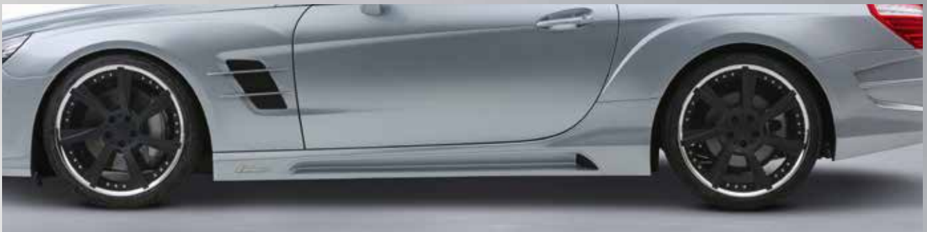
Lorinser-typische Kiemen im Kotflügel, Seitenschweller mit großen Luftöffnungen