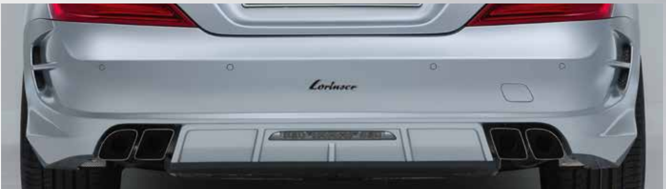
Markante Heckschürze inklusive Sportauspuff mit vier Endblenden