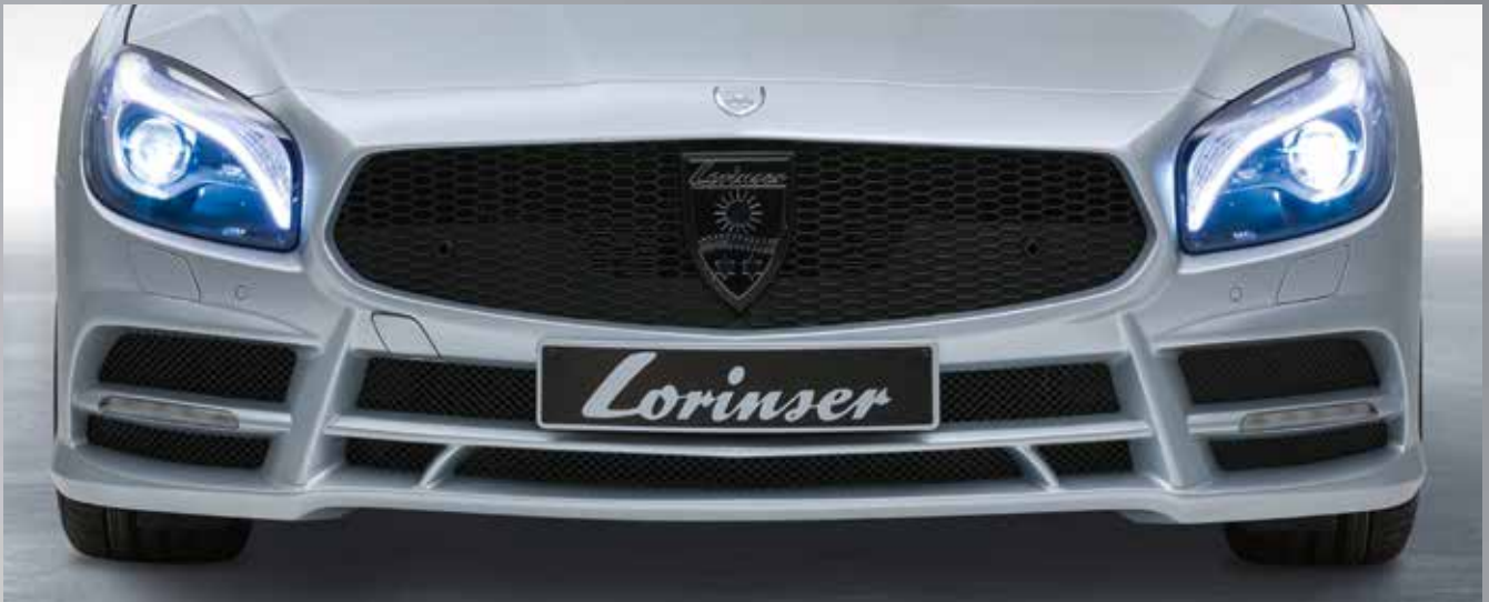
Markanter Spoilerstoßfänger mit Gittereinsätzen, fließender Übergang in Lorinser Kotflügel