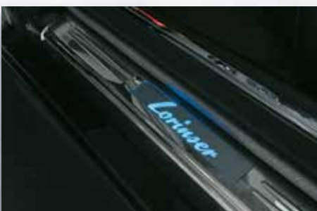
Einstiegsleisten mit beleuchtetem Lorinser-Schriftzug / Door sills with illuminated Lorinser logo