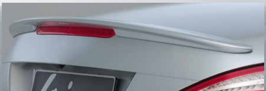
Sportlich gestalteter Heckflügel Rear wing with sporty design